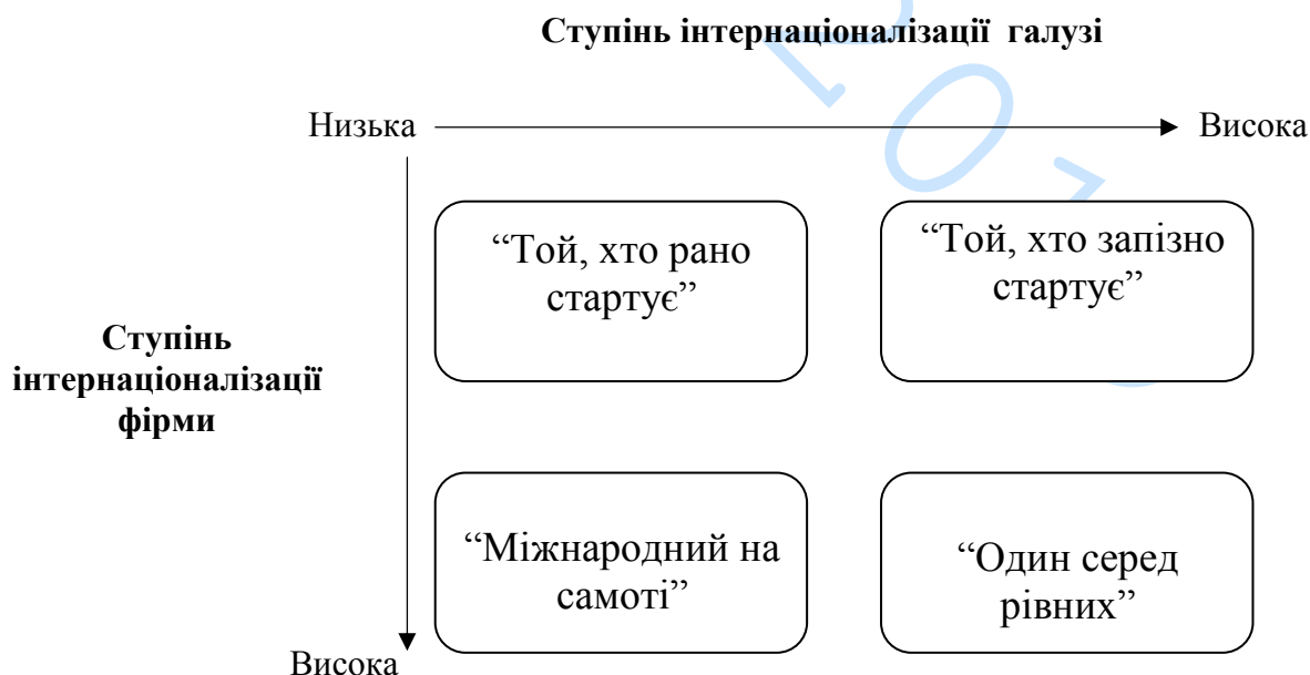
Рис. 1.4. Матриця "ступінь інтернаціоналізації галузі/ ступінь інтернаціоналізації фірми"

Модель життєвого циклу галузі А. Д. Литла.