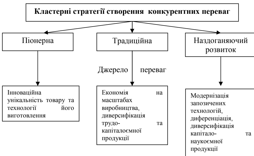
Рис. 1.2. Кластерні стратегії створення конкурентних переваг